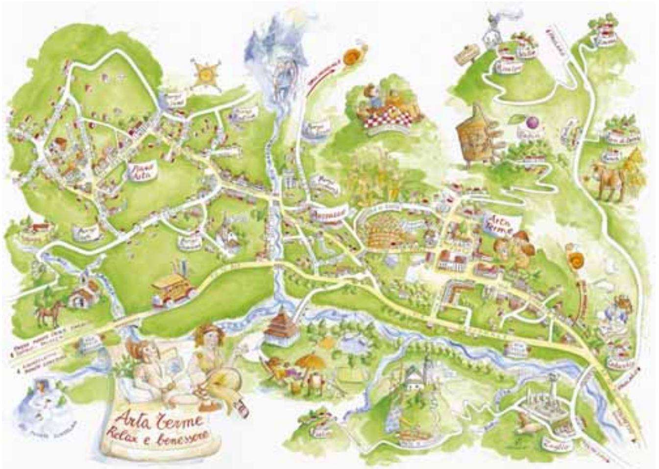
Arta Terme cartina tematica

Arta Terme era conosciuta già dai Romani per gli effetti benefici delle sue acque sulfuree, ma la sua notorietà si spinse fino all'800 come testimoniano i versi di Giosuè Carducci , che rimase incantato dalla bellezza della Carnia. Luogo incontaminato ideale per trascorrere vacanze rigeneranti e molto spesso utilizzato per i ritiri precampionato delle società professionistiche di calcio, che sanno apprezzare l'eccezionale clima estivo e l'aria pura. Arta non è solo terme: passeggiate ed escursioni affascinanti a piedi, a cavallo o in bicicletta, le piste da sci dello Zoncolan a solo un quarto d'ora, impianti sportivi, buoni alberghi, possibilità di affittare appartamenti, ristoranti rinomati per la loro cucina e un patrimonio d'arte tutto da scoprire. E non solo, in questo periodo ospita il 71 campionato assoluto di Dama Italiana, un grande evento che pone Arta al centro dell'attenzione mediatica e del mondo damistico in